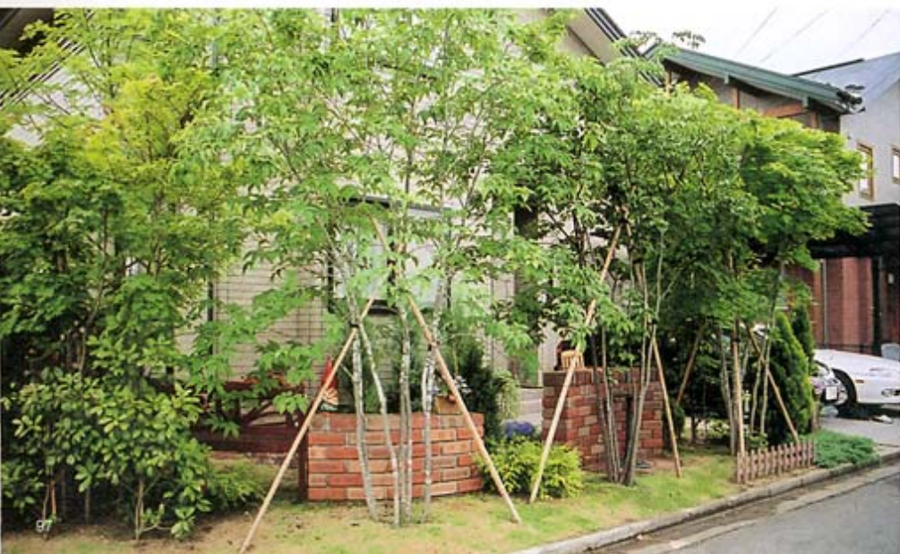
◎道路に面した庭を樹木で目隠しすると、通りがかりの人の目にもやさしい。

建物、周囲の環境、そして視線や人・車などの動線をうまくデザインに取り入れること、そして何よりも住む人のライフスタイルにあったプランを心掛けています。