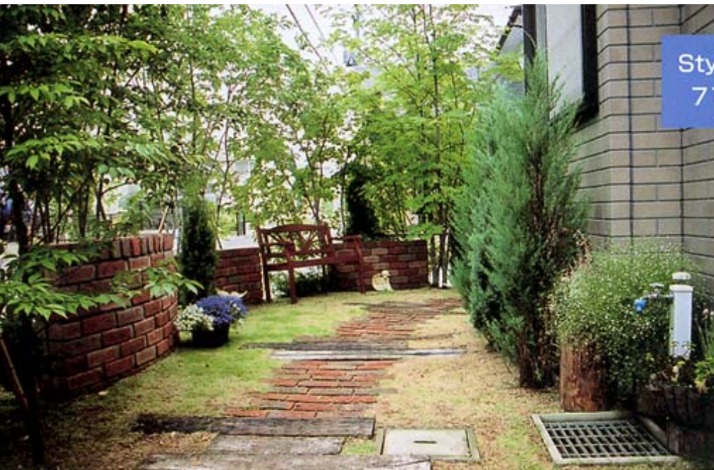
◎樹木から陽の光がこぼれるレンガの小道はまさに高原の雰囲気。

角地に建つK邸。庭づくりにおいて、自然をテーマにプランすることが多いのですが、こちらの実例は、まさに自然というテーマにピッタリのプランとなりました。 前面道路はわりと人通りが多いのですが、特に高さのある壁をつくって敷地内のプライバシーを確保するようなことをせず、樹木を利用した目隠しを考えました。 枕木に積んだレンガはゆるやかなR(曲線)を描き、樹木同士をつないでいくようなラインにしました。まるで高原にいるような気持ちで、レンガの小道を歩くことができます。