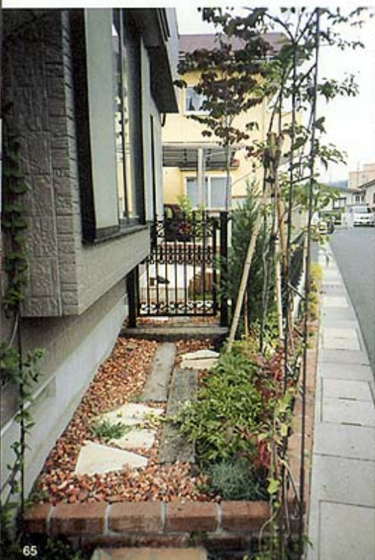
◎リビング前の庭へ続く小道。このスペースの演出にプランナーのこだわりが。