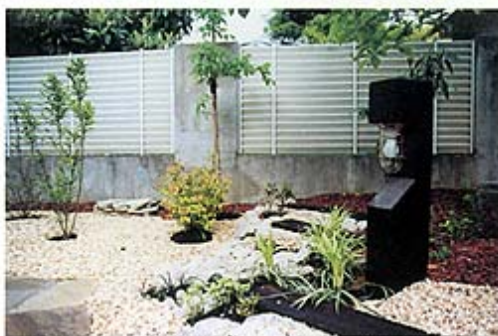
◎枕木にセットされた照明は、庭全体を明るく照らしてくれます。