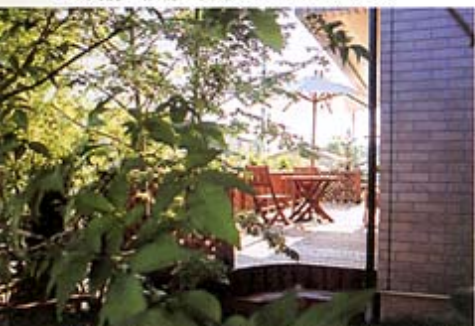
◎葉陰から見えるデッキはいかにも心地よさそう。