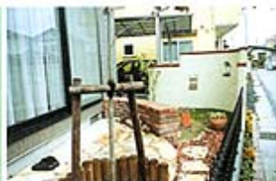
◎塗り壁の中は、プライベートスペースに。

岩手県K邸 施工面積 約25坪 施工期間 約30日間 施工費用 約20万円 施工 1 トータルエクステリア