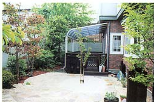
◎ウッドデッキには、日除けをつけて、日差しをやわらげて。