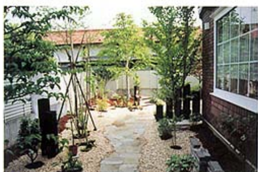
◎奥へと続く小道の両側に照明を配し、夜間の歩行にも配慮しています。