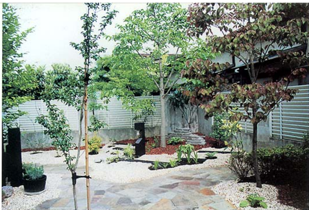
◎この庭のメインとなるコーナー部分のシェードガーデン。