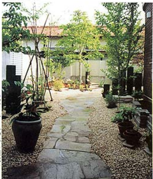
◎ポリウムのある植栽をうまく配置して、床面の処理によってまとめています。